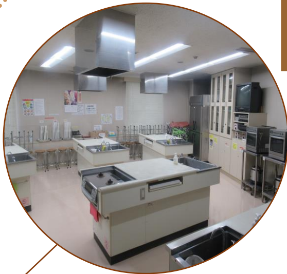
広い5台の調理台と2口ガスコンロ