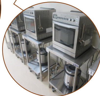
ガスオーブンとガス釜(1升炊き)