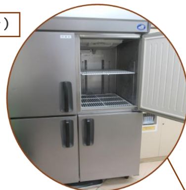
業務用の冷蔵庫と冷凍庫

社会教育センターの調理室には、広い調理台と大きな冷蔵庫、ガスオーブン、パンづくりやお菓子づくり用の調理器具などが揃っています。