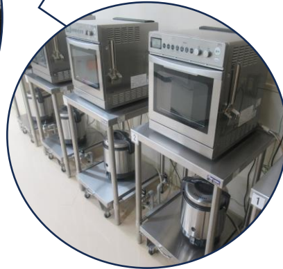
ガスオーブンとガス釜(1升炊き)