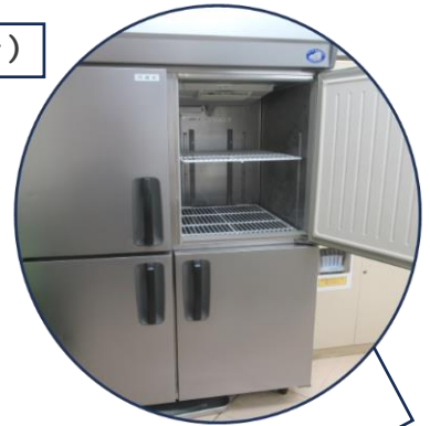
業務用の冷蔵庫と冷凍庫

社会教育センターの調理室には、 広い調理台と大きな冷蔵庫、ガスオーブン、お菓子づくりやパン作り用の調理器具 などがそろっています。