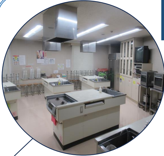
広い5台の調理台と2口ガスコンロ